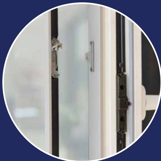
Antina esterna apribile per l'ispezione della tenda